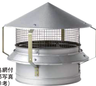
防鳥網付 内部写真 (参考)