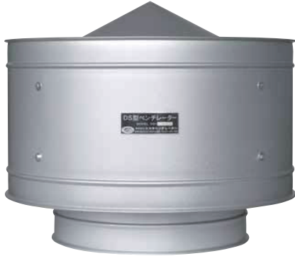
JG：直付型／ガルバ鋼板製

自然固定DS型は、室内温度が外気温度より高いと生じる温度差を利用した換気方法です。 強制換気を必要とする程、きびしくない建物に構造と外部との関係を十分に検討して、省エネ換気をお薦めします。