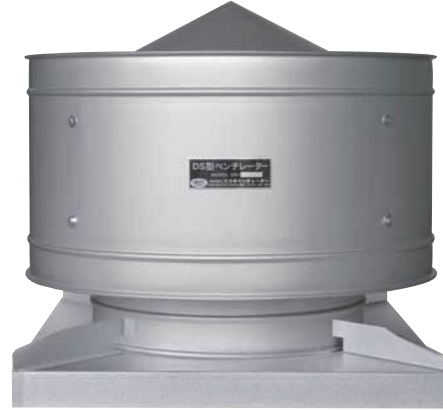
KG：架台型／ガルバ鋼板製