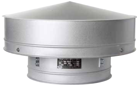
JG：直付型／ガルバ鋼板製

強制換気を必要とする程きびしくない場所や、自然上昇物（熱気、蒸気、煙等）を排出する排気口として利用できます。