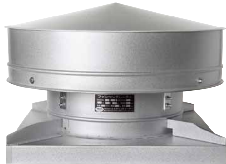
KG：架台型／ガルバ鋼板製